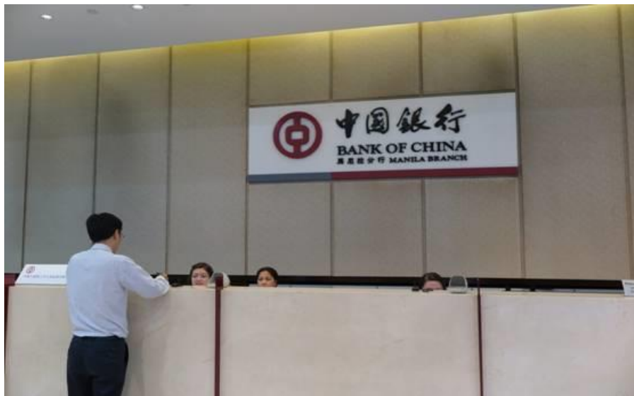
中国银行马尼拉分行

菲律宾政府在2013年5月份修订了第10574号共和国法案（即外资参股农村银行法）和第7353号共和国法案（即农村银行法修正案），允许外国投资者收购或购买农村银行60%的投票权股。