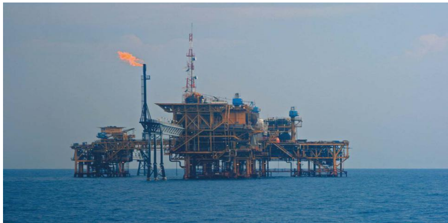
中海油在印尼的作业平台

【承包劳务】据中国商务部统计，2019年中国企业在印度尼西亚新签承包工程合同1295份，新签合同额140.81亿美元，完成营业额87.05亿美元。累计派出各类劳务人员18356人，年末在印度尼西亚劳务人员24983人。新签大型承包工程项目包括中国葛洲坝集团股份有限公司承建印度尼西亚卡扬A水电站项目；中国水电建设集团国际工程有限公司承建印度尼西亚卡扬河1级900MW水电站项目；上海电气集团股份有限公司承建印度尼西亚巴利岛2×400MW燃机联合循环电厂项目等。