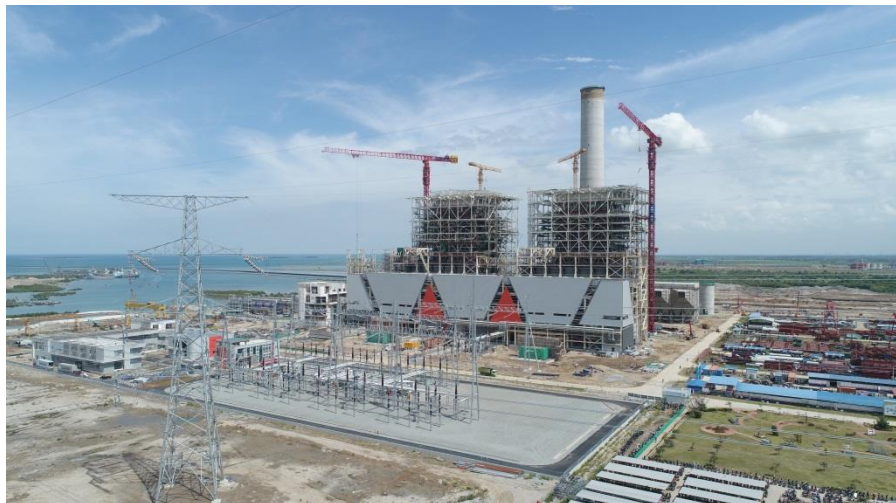
神华国华印尼爪哇7号项目

【货币互换】2018年11月，中国人民银行与印尼央行续签了双边本币互换协议，旨在便利两国贸易和投资，维护金融市场稳定。协议规模为2000亿元人民币/440万亿印尼盾，协议有效期三年，经双方同意可以展期。