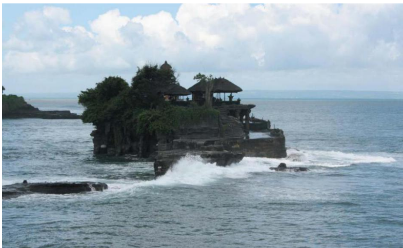
巴厘岛著名景点——海神庙

【同马来西亚的关系】马来西亚联邦与印尼于1957年建交，1963年9月马来西亚成立后两国断交，1967年两国复交。2008年1月、2010年5月和2012年12月，印尼总统苏希洛访马。2015年2月佐科总统对马来西亚进行访问。