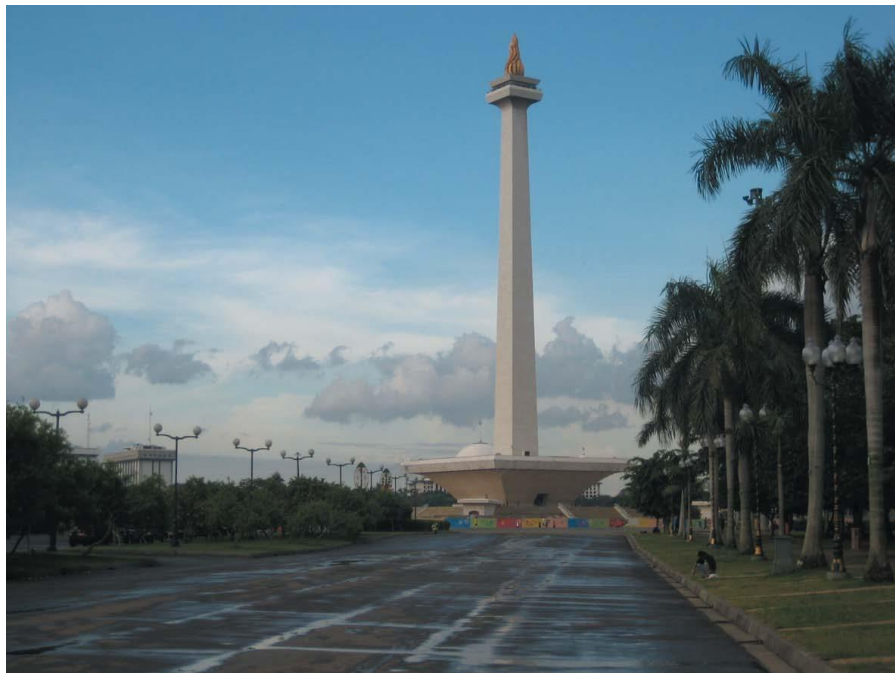
印尼独立纪念碑广场

【政府】实行总统制，总统既是国家元首，也是政府首脑，同时掌管三军。总统、副总统均由全民直选产生，任期5年，总统可连任一次。现任总统为佐科·维多多，副总统为马鲁夫·阿敏，本届内阁于2019年10月组建，任期至2024年。