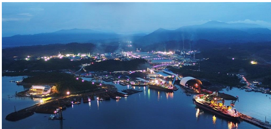
中国企业在印尼投资的青山工业园

【重要合作项目】中国企业在印尼主要投资和承包的项目有：风港电站、达延桥项等工程项目，爪哇7号、南苏1号等一大批电站建设项目，以及青山镍铁工业园、西电变电器生产项目等。