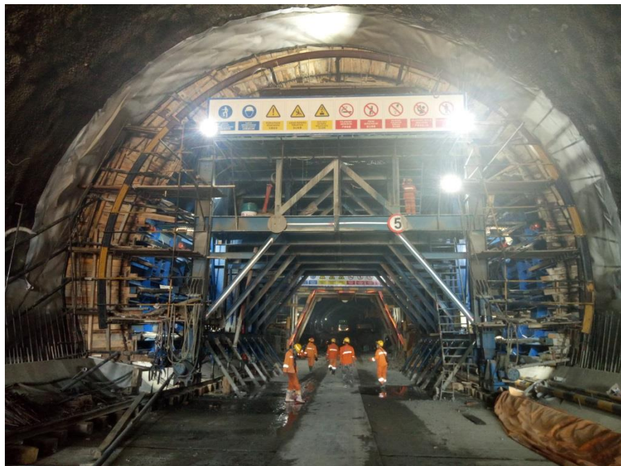
雅万高铁施工现场