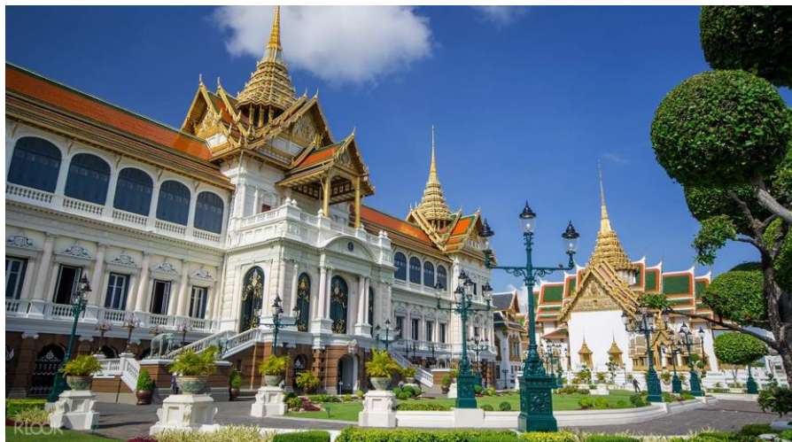
泰国著名景点——大皇宫

泰国全国大部分地区属热带季风气候，全年明显分为热季（2-5月中旬）、雨季（6-10月中旬）和凉季（11-翌年2月）3个季。全年平均气温27.7℃，最高气温可达40℃以上。年平均降水量为1100毫米。平均湿度为66%-82%。