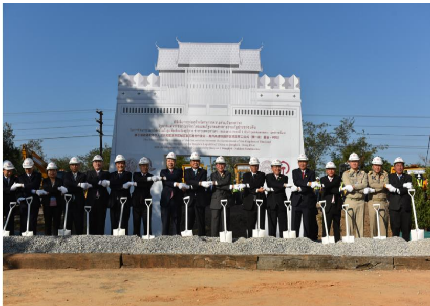
中泰高铁正式开工仪式

此外，由曼谷搭火车到马来西亚，日夜都有定期车次，无论是特快或普快，都有冷气设备。曼谷至吉隆坡，需时约40小时。曼谷至新加坡，需时约46小时左右。