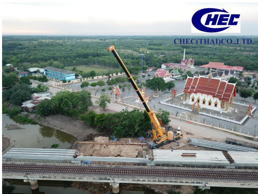
中国港湾（泰国）有限公司

筑股份有限公司、中国港湾工程有限责任公司、中国电力建设集团有限公司、中国铁建股份有限公司、中国中铁股份有限公司等多家具有国际竞争实力的中国企业均在泰国开展业务，主要涉及电力工业、房屋建筑、石油化工、基础设施等领域。