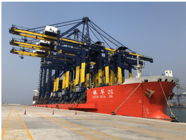
中国港湾承建泰国廉查帮港三期D区集装箱码头项目 【货币互换】2011年12月，泰国与中国达成双边互换协议。当时，这