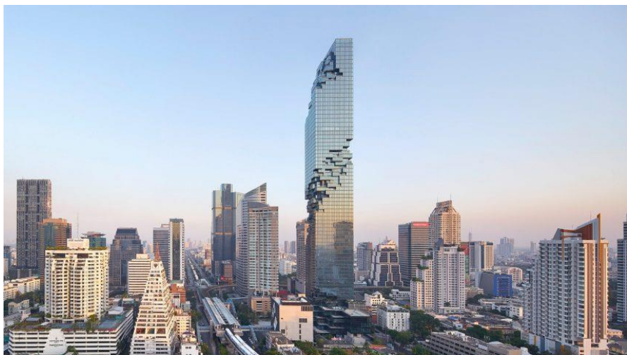
泰国最高建筑——曼谷大都会大厦

泰国第二大城市清迈是泰国著名的历史文化古城，建于1296年，是泰国北部政治、经济、文化、教育中心，距曼谷700公里，位于海拔300米的高原盆地，作为兰纳王朝的首都，其所建城垣大多保存至今。清迈府总面积3905平方公里，人口约176万；首府清迈市面积40平方公里，人口约13万。